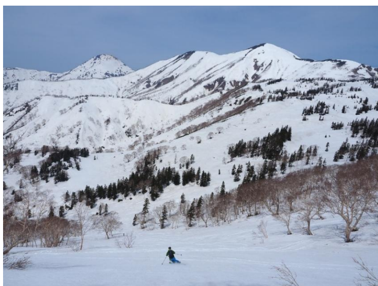
焼山、火打山を見ながら滑る 黒沢岳西面